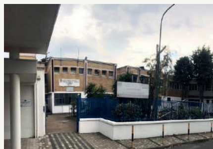
Via G. Garibaldi, 95 Nola 80035 Napoli

www.leonenobile.edu.it tel. 081 823 14 29