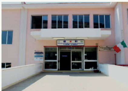
Via dei Mille, 117 Nola 80035 Napoli

sabato ORE 14.00 - 18.00 e domenica 9.00 - 12.00